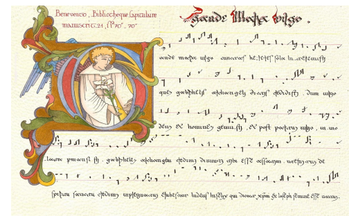
Enluminure : Véronique FRAMPAS